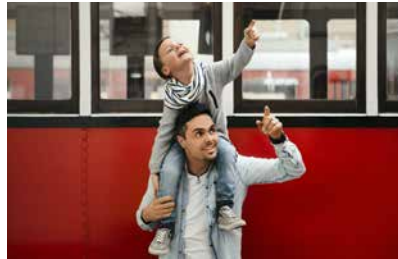
Das Museum für Öffi-Begeisterte, historisch Interessierte, Wien-Fans und alle Neugierigen.

Eigentümer, Herausgeber und Verleger: Wiener Linien GmbH & Co KG Gestaltung: Rotfilter GmbH, www.rotfilter.com Druck: Lischkar, 1120 Wien, Änderungen vorbehalten.